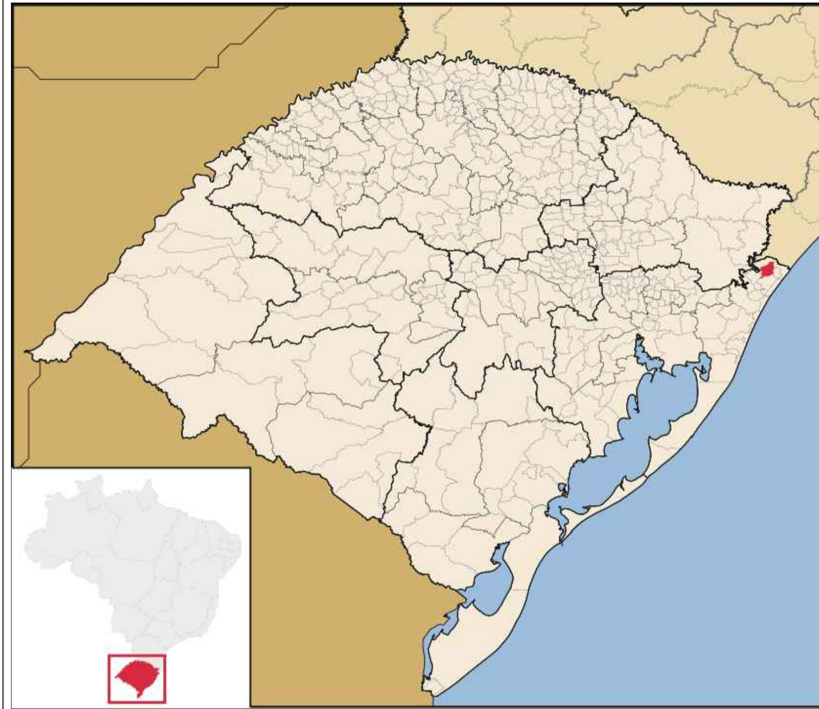
Mapa do Estado do Rio Grande do Sul